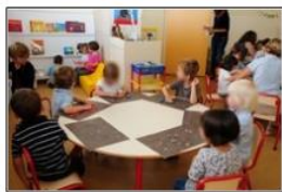
Mission maternelle DSDEN 44