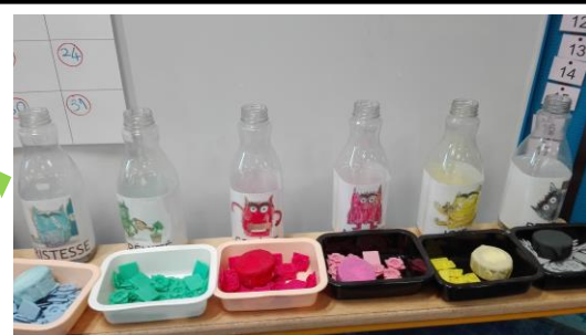
Classe de GS de la maternelle Fournier à Angoulême