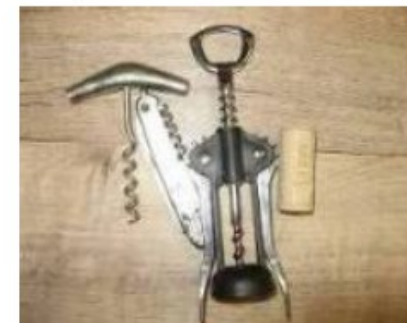
Catégorie thématique : pour servir le vin