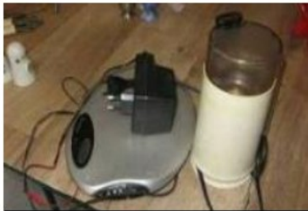
Les appareils électriques