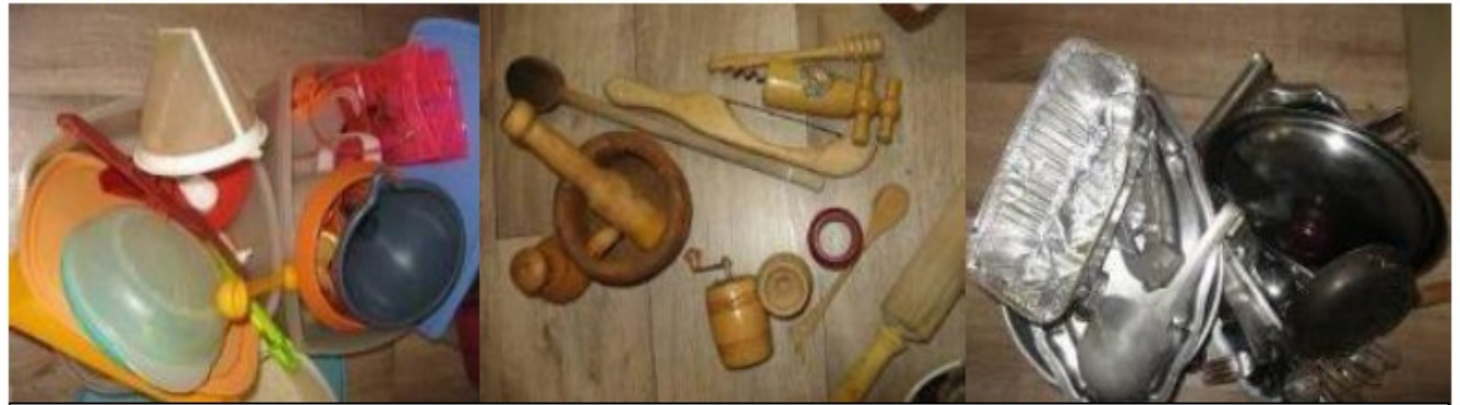
Les matières : plastique, bois, métal