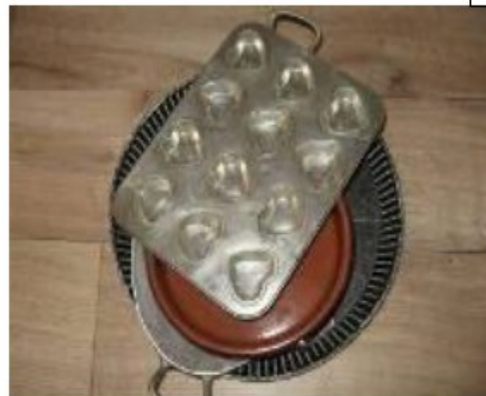
Les moules « ça sert à cuire »