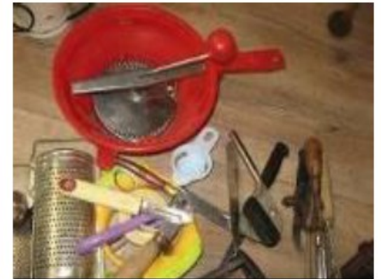
Les fonctions : écraser, râper, éplucher...